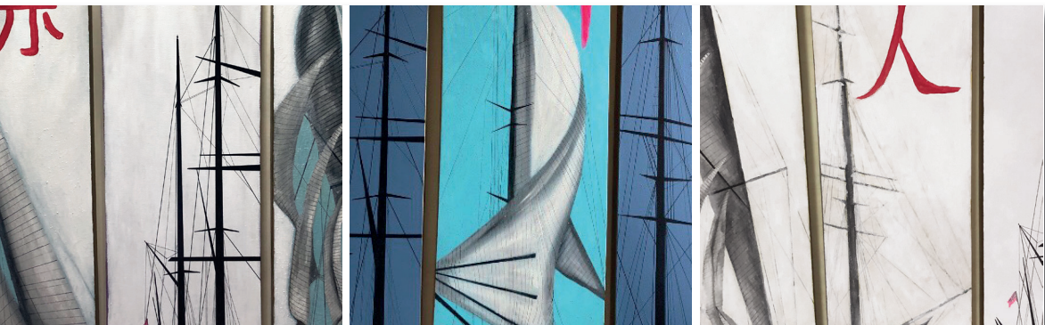
Red / Rouge